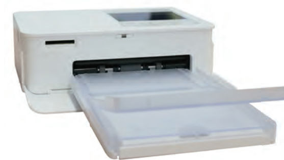
初期費用が安く場所を取らない 通常印刷タイプ