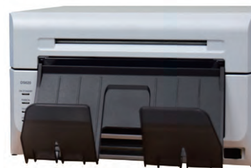
印刷が早くランニングコストも安い 高速印刷タイプ

一度に大量に印刷をする場合は高速印刷タイプ、1枚ずつ印刷する場合は通常タイプ、使い方に合わせてプリンタを選択できます。